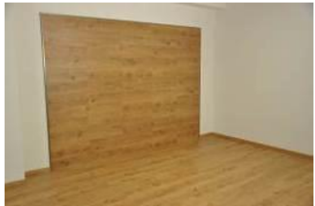
19. Résultat final