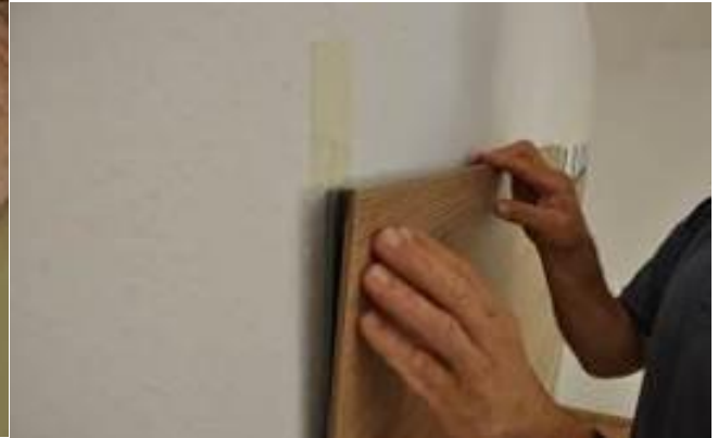
17. Encliquetage de la dernière rangée