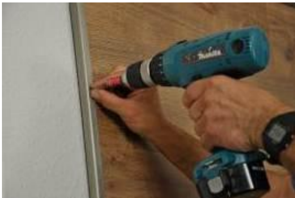
18. Pose du cadre en aluminium