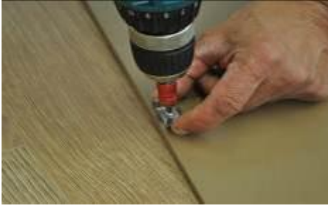
16. Fixation des agrafes de fin