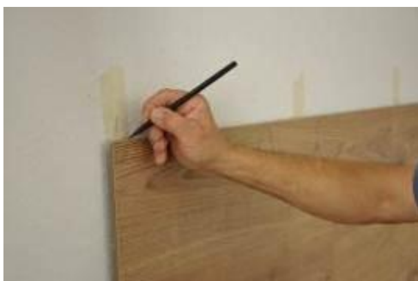
15.a. Report de l'emplacement 1

Attention : Vous devez scier la rainure des éléments de la dernière rangée.