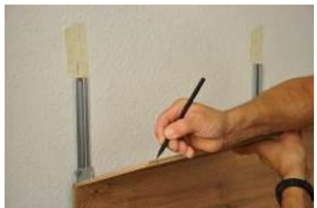
15.a. Report de l'emplacement 2