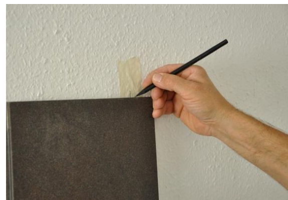
15. Report de l'emplacement 1

Attention : Vous devez scier la rainure des éléments de la dernière rangée.