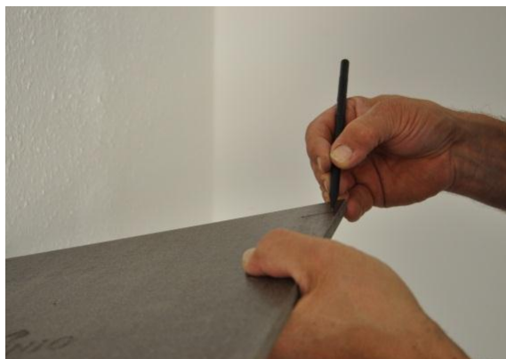
15. Report de l'emplacement 2