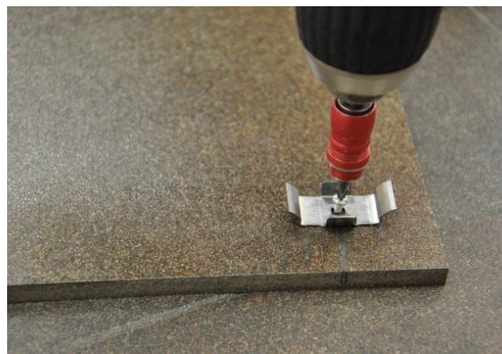
16. Fixation des agrafes de fin