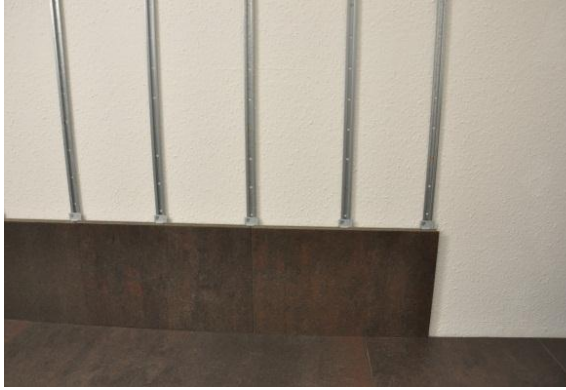
12. Posez une agrafe sur chaque rail de fixation.