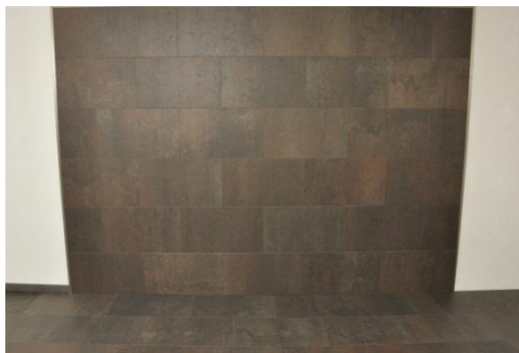
19. Résultat final