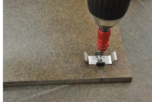
16. Anbringung der Endklammern