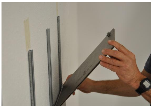
17. Einklicken der letzten Dielenreihe