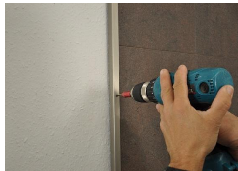
18. Zur seitlichen Abdeckung der Wandelemente montieren Sie die passenden HARO Abdeckleisten.