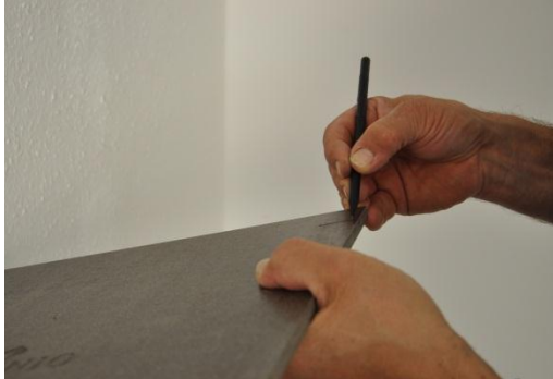
15. Übertragen der Markierung 2