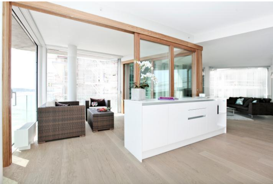
Luftig leicht wirkt die Wohnung durch die großen Fensterflächen und den weißen Parkettboden HARO Parkett 4000 Landhausdiele Eiche Markant strukturiert 2V bioTec Öl-/Wachs-Finish