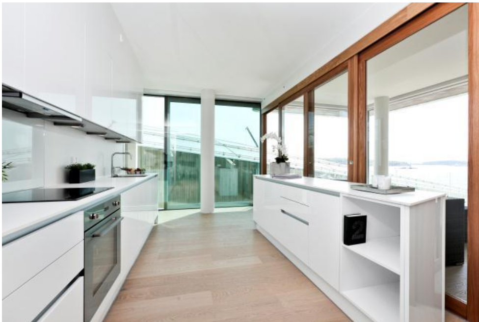
Kochen mit Blick auf's Meer und mit edlem Holzboden unter den Füßen