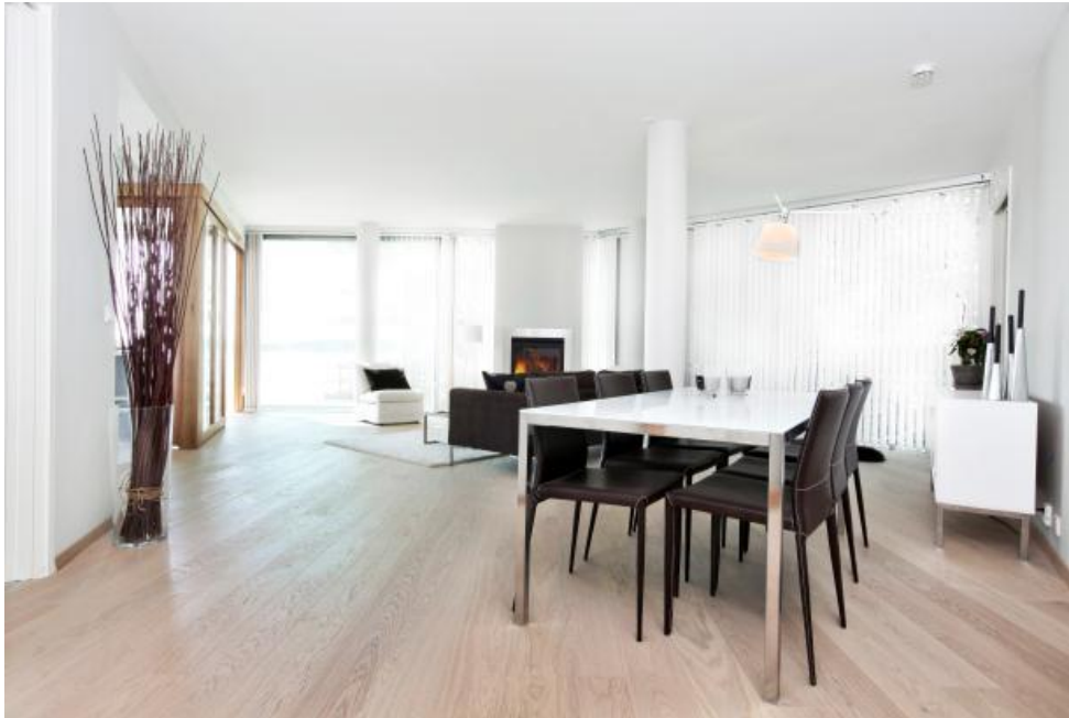
Die weißen Eiche-Landhausdielen von HARO unterstreichen die Weitläufigkeit der Wohnung