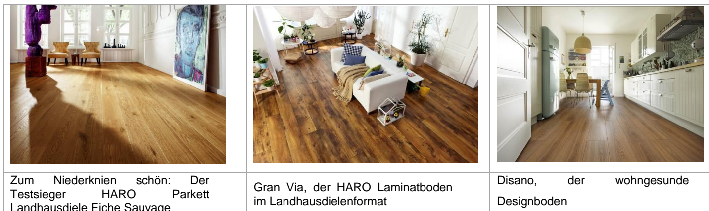
Foto: HARO – Hamberger Flooring GmbH & Co. KG Abdruck frei – Beleg erbeten

Weitere Informationen zum Aktionssortiment und zum nächsten HARO Fachhändler unter www.haro.de/aktion . ■