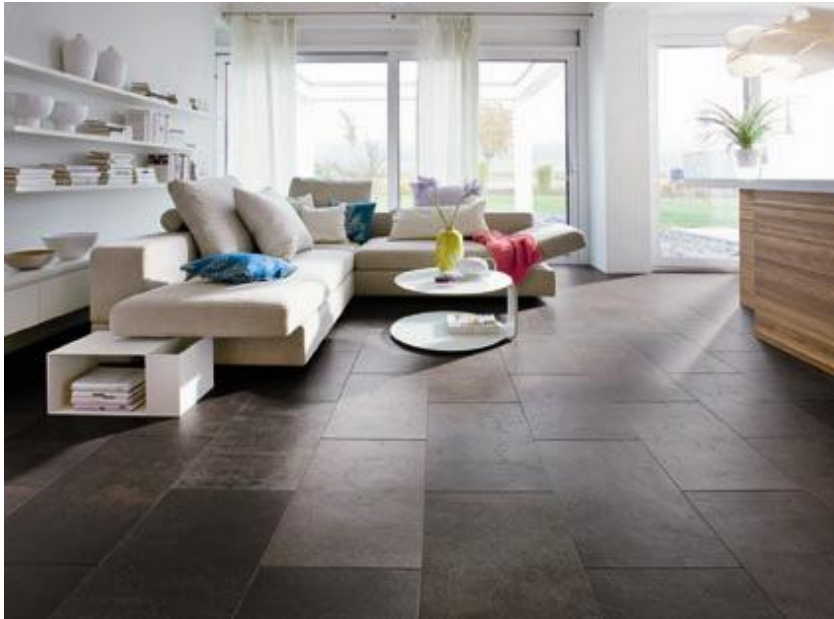
Celenio Athos ferro: Komposition von Natur und Design